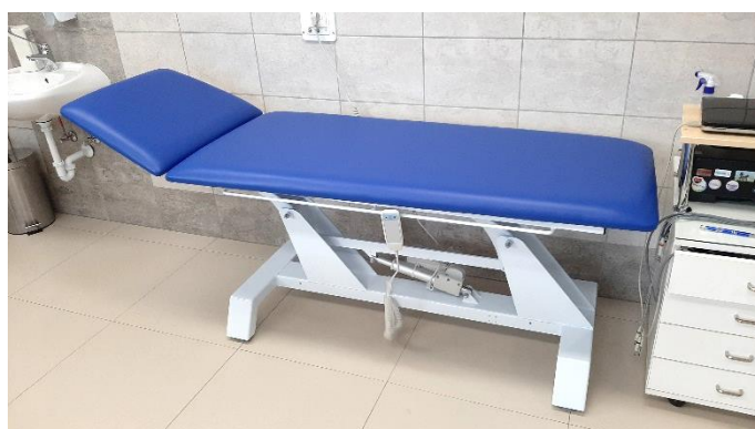
és az új