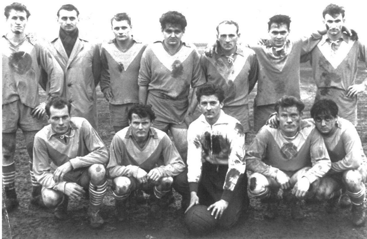
A csapat tagjai

1964. novemberében 3 csapat küzdött a megyei I. osztályba való feljutásért. Az osztályozó mérkőzésekre a ZTE régi salakos pályáján került sor. A végeredmény: Baki MEDOSZ, Nagykanizsai Gazdász, Csesztreg – az első két csapat jutott fel a megyei I. osztályba.